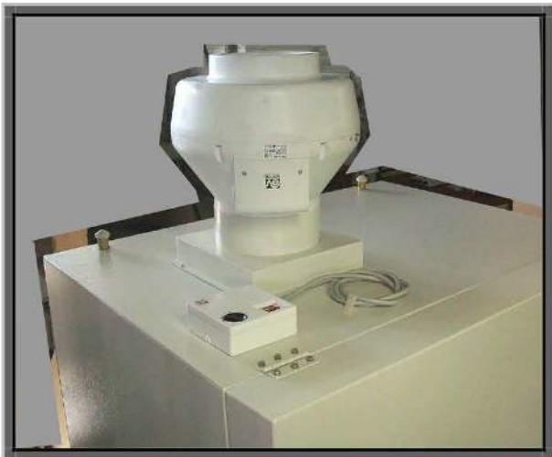
Ventilatore supplementare con gruppo interruttore / regolatore di velocità, posizionati sul tetto della cappa.