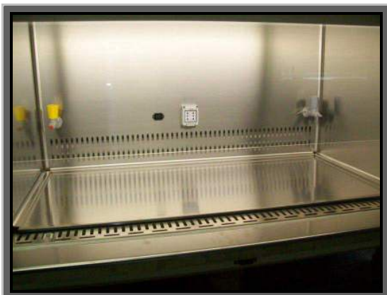
Piano di lavoro intero a bacinella