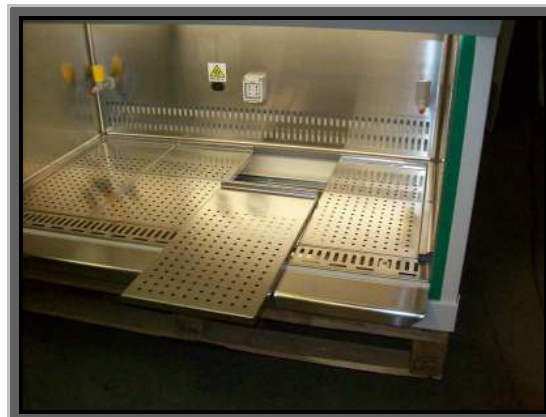
Piani di lavoro forati removibili e autoclavabili con vasca di raccolta liquidi sottostante